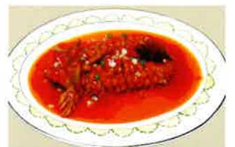
「糖醋鯉魚」(鯉の甘酢あんかけ)