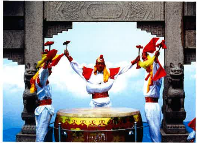
泰山の天街に鳴り響く太鼓の音

碧霞祠は泰山頂上に築かれた最大建築群で、中国の国文化財に指定された全国最大の道観(道教寺)である。宋の大中祥符年間(1008-1016)に建てられた2ブロック構造の建物。中軸線上には照壁(目隠し壁)、金蔵庫、南神門、大山門、香亭、大殿などの建物があり、両側はそれぞれ西神門、鐘鼓楼、東西御碑亭、東西脇殿が配されている。南神門外側にある金蔵庫は、俗に火池と称され、主に参拝者が線香を燃やすところとして用いられ