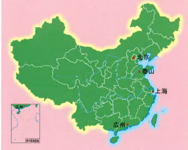
中国地図における泰山