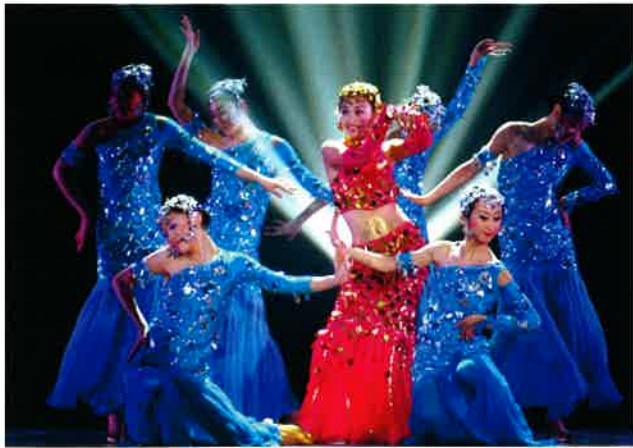
公演中の泰山「激情の夜」

でなく、文化財が集まっているところでもある。ここには歴代の帝王が泰山の神を祭るときに残った数多くの祭祀道具や供え物もあれば、歴史文物と革命文物も数多く出土している。このうち、岱廟に保管されている176枚の歴代の碑刻、漢画、石像などは特に珍しい。